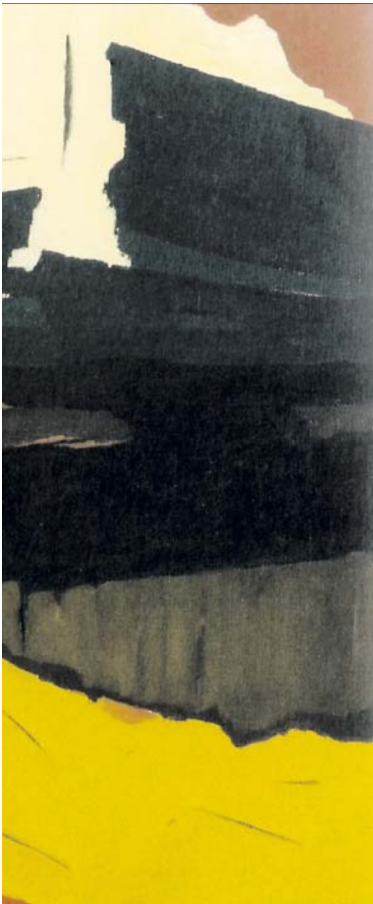
orden ist.