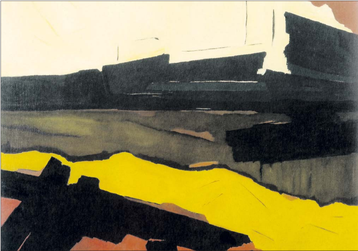
Die Farben der Erde dominieren das Landschaftsgemälde mit dem Titel „Settembre“, das im Jahr 2007 gemalt worden ist.