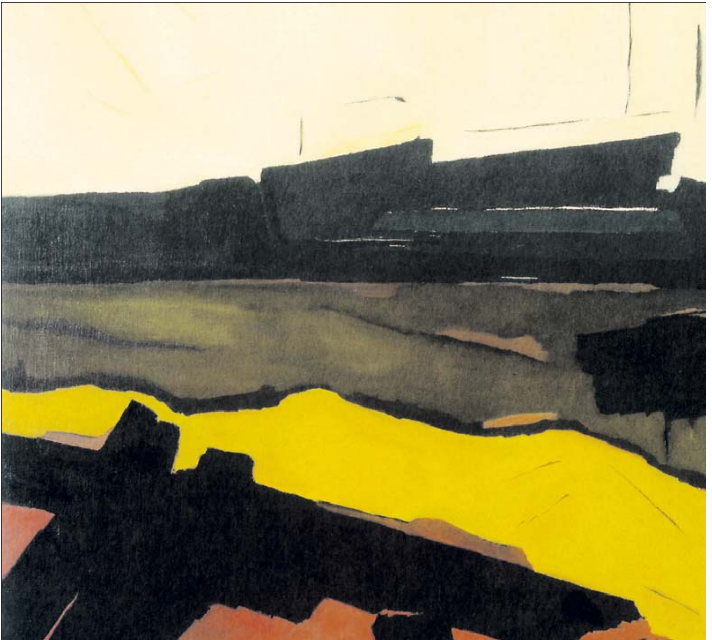
Die Farben der Erde dominieren das Landschaftsgemälde mit dem Titel „Settembre“, das im Jahr 2007 gemalt worden ist.