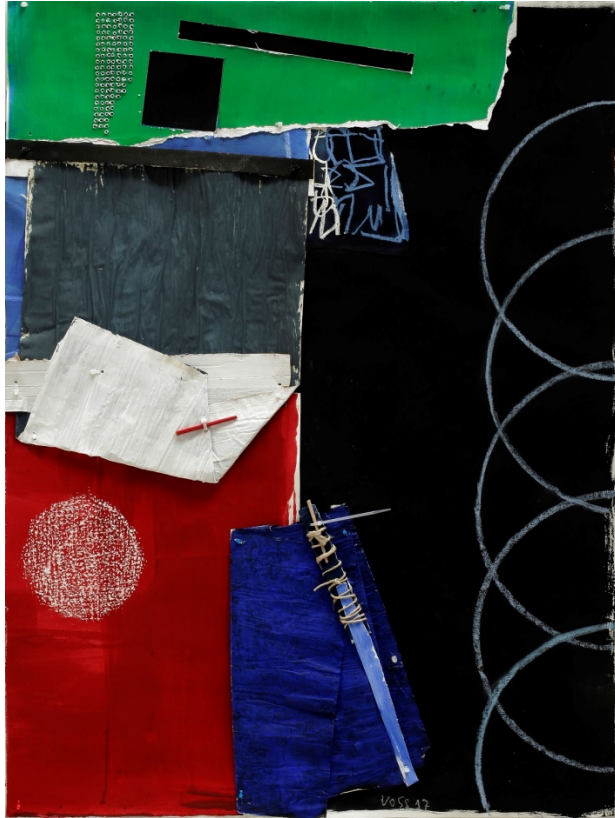
Message I, 2017, Acryl, Collage, Mixed Media /Papier, 113 x 85 cm