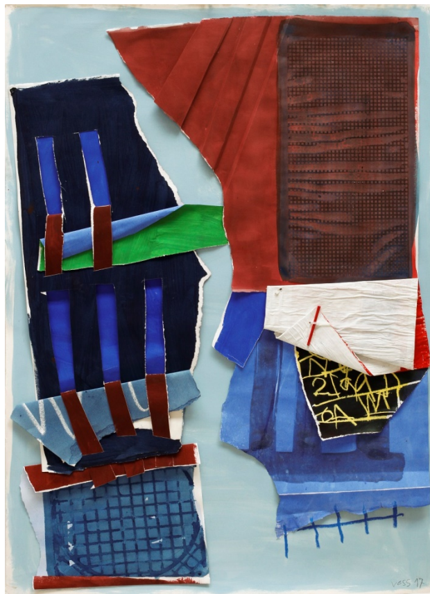
Message II, 2017, Acryl, Collage, Mixed Media /LW, 124 x 90 cm