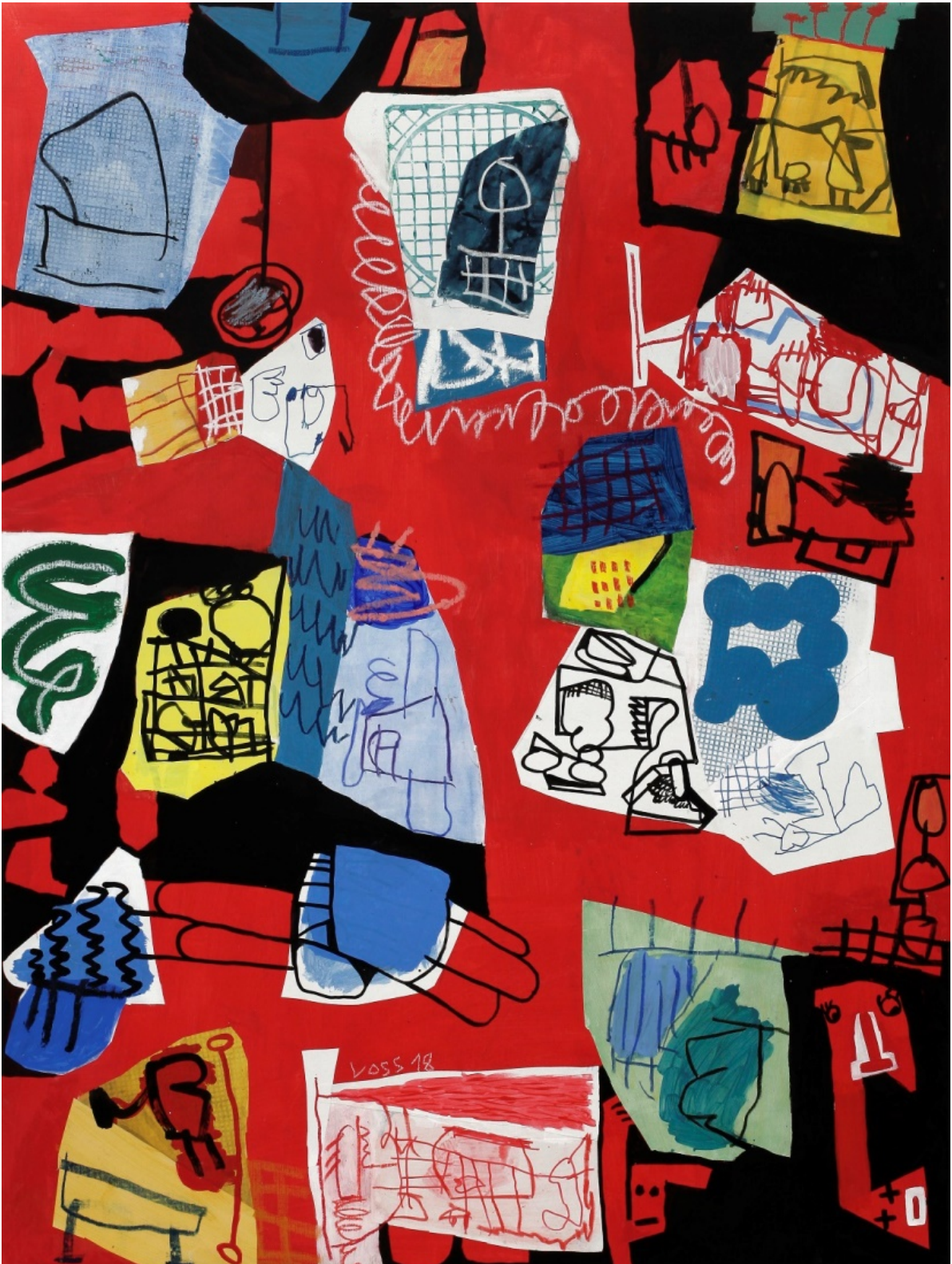
Ohne Titel, 2018, Acryl, Collage / LW, 200 x 150 cm